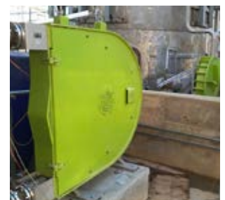
ALX150 et ALH125 dosage de produits chimiques pour l'industrie minière