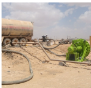
ALH125 Pompage de pétrole brut