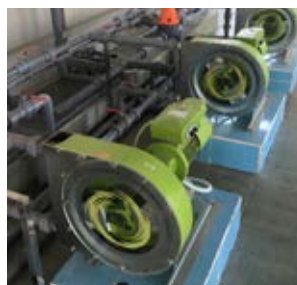
ALP30N Dosage de chaux