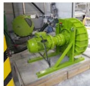
ALHX80 Alimentation de filtre-pressé